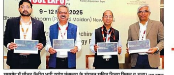
समाज में नौटंकी क्षेत्रीय महिला उद्योग प्रदर्शन के संस्कार समारोह में भाग ले रहे हैं। अमर उजाला

नई दिल्ली। सिलिकॉन कोटेड ब्लोअर का उपयोग बढ़ रहा है।